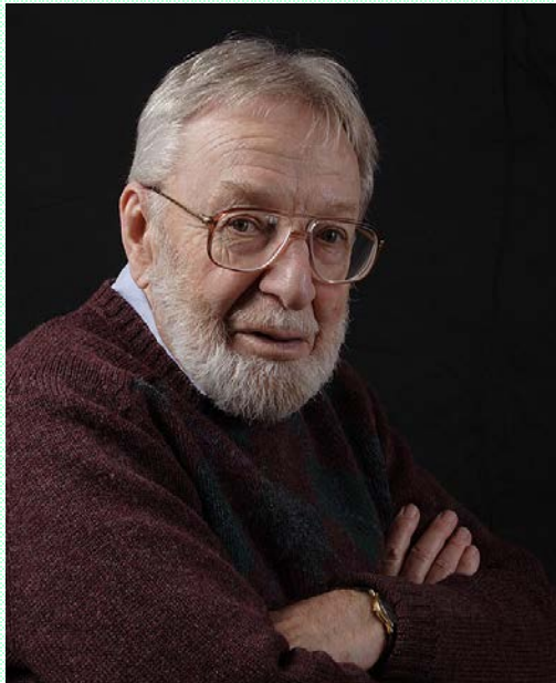
Melford Spiro (1920-2014)