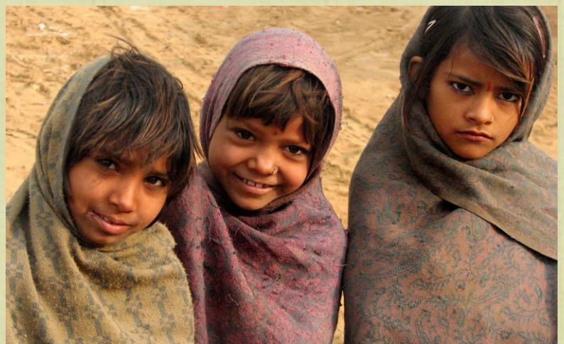
שלושה ילדים מצטופים בקור עטופים בשמיכות מהוות במחוז צ'יראוה במרכז רג'סטאן